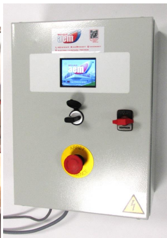
Coffret 400x300mm à 1 carte de commande ET35ASBP