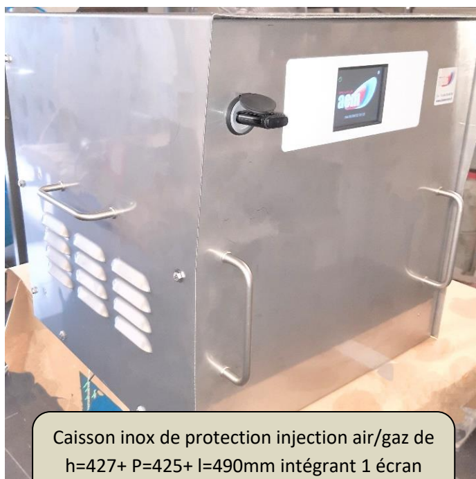
Caisson inox de protection injection air/gaz de h=427+ P=425+ l=490mm intégrant 1 écran tactile ET35ASBP en 230Vac mono+T

Ces brûleurs peuvent fonctionner en gaz naturel G25 à 25mbar et en butane G30 de 28 à 50mbar. Quel que soit le type de gaz, la pression ne doit pas dépasser 65mbar. Tous les brûleurs à air soufflé sont sur mesure.